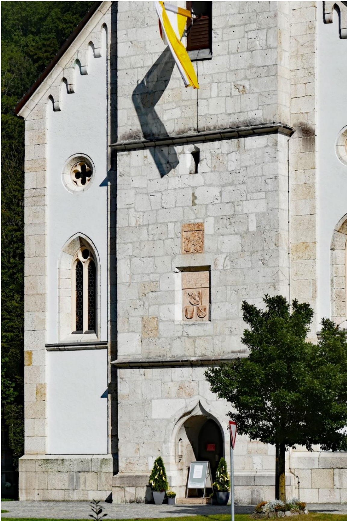
In den Turm der Pfarrkirche St. Nikolaus in Marktschellenberg sind zwei Marmortafeln eingelassen.